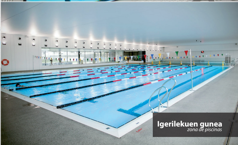
Igerilekuen gunea zona de piscinas