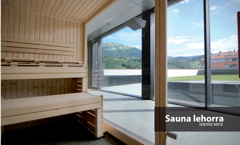
Sauna lehorra sauna seca