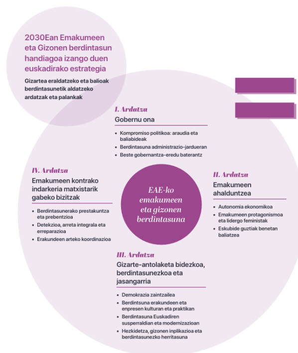
EAE-ko emakumeen eta gizonen berdintasunerako 2030 estrategia

EAE-ko emakumeen eta gizonen berdintasunerako 2030 Estrategiaren xedea da euskal botere publikoei beharrezko jarraibideak eta orientabideak ematea, beren politiken bidez egungo gizarte-antolaketa patriarkalaren ereduaren alternatiba bat eraiki ahal izateko. EAE-ko emakumeen eta gizonen berdintasunerako 2030 Estrategiak 4 ardatz nagusi ditu: Gobernu ona, Emakumeen ahalduntzea, Gizarte-antolaketa bidezkoa, berdintasunezkoa eta jasangarria eta emakumeen kontrako indarkeria matxistarik gabeko bizitzak. Estrategiak 13 helburu estrategiko, 31 lan-ildo eta 128 helburu espezifiko jasotzen ditu.