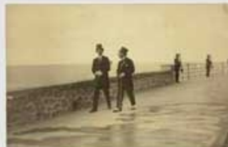
1919ko gorteko irudi. Irudiak ez dira berberak. (M.A. & 202005). © 2020 M.A. & 202005. Irudiak ez dira berberak.