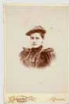
1894ko gorteko irudi. Irudiak ez dira berberak. (M.A. & 202005). © 2020 M.A. & 202005. Irudiak ez dira berberak.