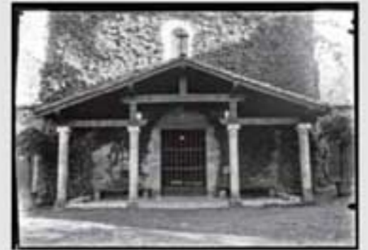
Santa Ana jauregia. BIA, 8, 20175.