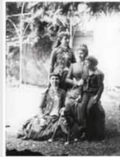
1880. Iratxearen inguruko paisaia. (1880). B.N. E. 00100.

Argazkigintza bere denbora-pasa gogoenetarikoa izan zen; eta Errotaldeko lorategia, argazki horien ohiko eszenatokia. Askotan antzematen da, gainera, argazkia ebaki baino lehen, irudia ateratzerakoan atzealdean erabiltzen zuten izara zuria. Beste batzuetan, berriz, Ignacio bera agertzen da argazkietan, horretarako urruneko kliskagailu bat erabilia.