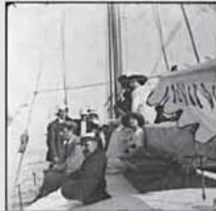
1911. Gaur egun gure gizartearen aisialdirako denbora izatea eta bidaiak egitea oso hedatuta dago.