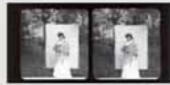
1880. Iratxearen inguruko paisaia. (1880). B.N. E. 00100.