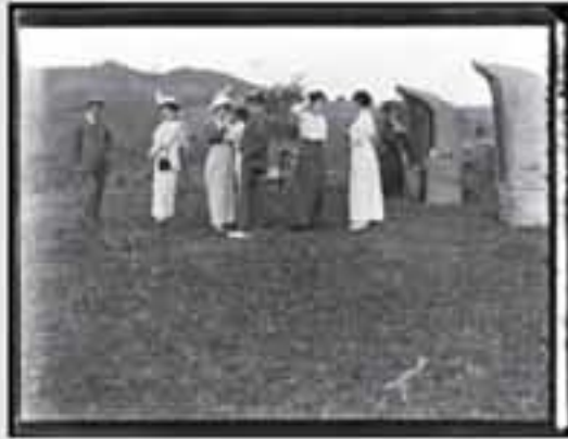
1911. Gaur egun gure gizartearen aisialdirako denbora izatea eta bidaiak egitea oso hedatuta dago.