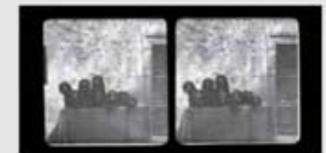
Tobalaba jauregia. BIA, 8, 20171.