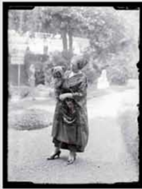
1880. Iratxearen inguruko paisaia. (1880). B.N. E. 00100.