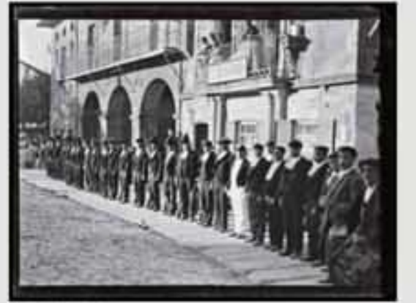
1911. Gaur egun gure gizartearen aisialdirako denbora izatea eta bidaiak egitea oso hedatuta dago.