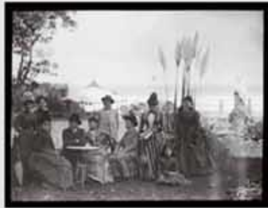
1911. Gaur egun gure gizartearen aisialdirako denbora izatea eta bidaiak egitea oso hedatuta dago.