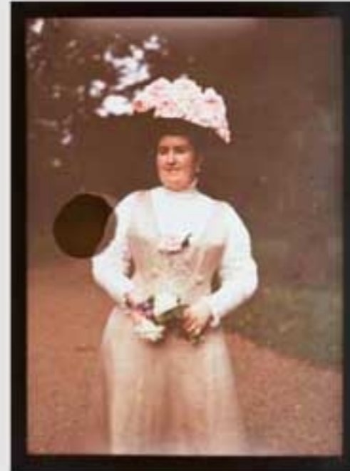
Begonia, 1920eko ezaberiaren Ama Ana Murua. BIA, 8, 20117. 1914 eta 1915eko argazkiak.