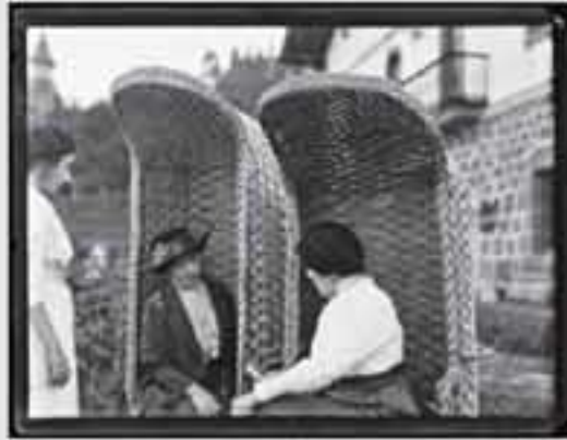
1911. Gaur egun gure gizartearen aisialdirako denbora izatea eta bidaiak egitea oso hedatuta dago.