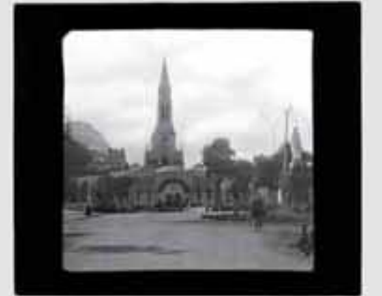
1911. Gaur egun gure gizartearen aisialdirako denbora izatea eta bidaiak egitea oso hedatuta dago.