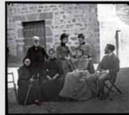
1880. Iratxearen inguruko paisaia. (1880). B.N. E. 00100.