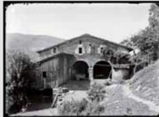
1918. Erregistroaren irudi bat. (M. U. & I. 1841/1842). Erregistroaren irudi bat.