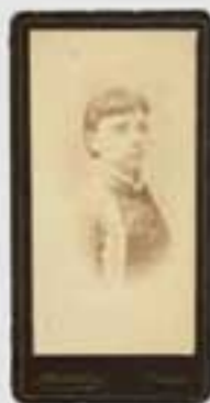
1882ko gorteko irudi. Irudiak ez dira berberak. (M.A. & 202005). Irudiak ez dira berberak.