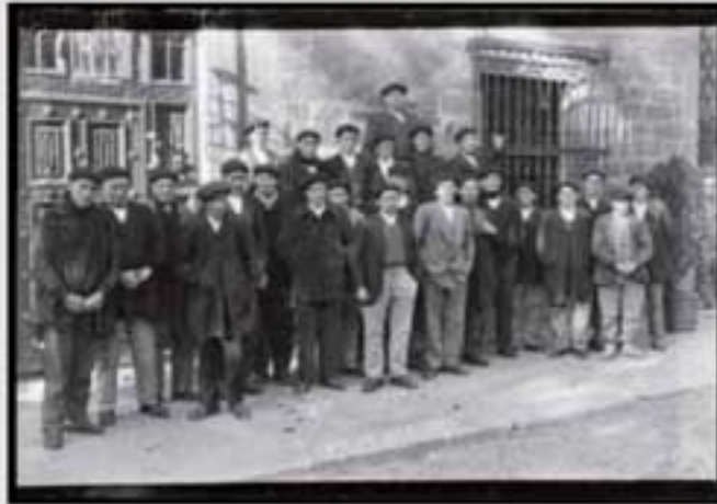
1841ko jurgaltze-erregistroaren (registro de bienes) ondoriozko erregistroaren irudi bat. (M. U. & I. 1841/1842). Erregistroaren irudi bat. (M. U. & I. 1841/1842).

Maiorazkoaren instituzioa –saldu ezineko eta atxikitako ondasun-multzoak mantentzea lortu zuen instituzioa– 1841. urtera arte egon zen indarrean, baina, hala ere, familia askotan dinamika horrek iraun egin zuen eta ondasun gehienak bakar batek hartzen zuen herentzian; eta gero ezkontzen estrategiari esker, gainontzeko oinordekoei dote-diruekin ordaintzen zieten bakoitzari zegokion senipartea (legitima).