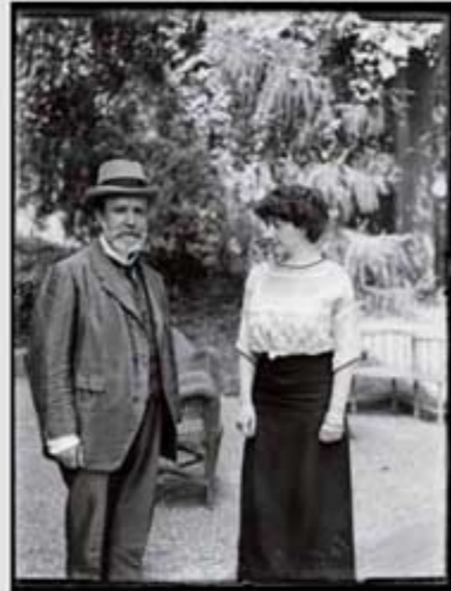
Valleko kondeak Errotaldeko jauregia. BIA, 8, 20148.