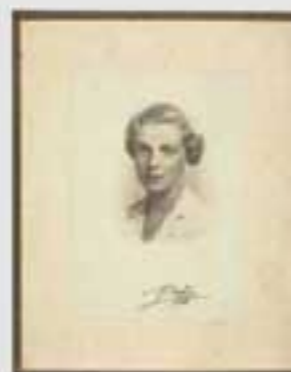
1919ko gorteko irudi. Irudiak ez dira berberak. (M.A. & 202005). © 2020 M.A. & 202005. Irudiak ez dira berberak.