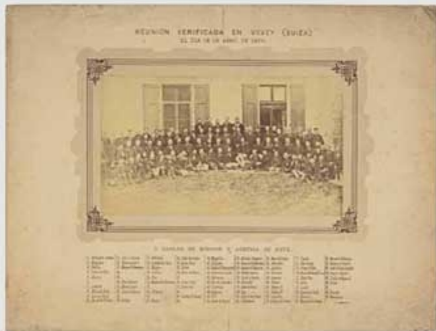
1879ko gorteko irudi. Irudiak ez dira berberak. (M.A. & 202005). © 2020 M.A. & 202005. Irudiak ez dira berberak.

Aitaren aldeko familatik XIX. mendetik zetorkion tradizio karlistaren oinordekoa izanik, Ignacio Murua 1907. urtean senatari izan zen hautagai-zerrenda katoliko eta foruzalearen barruan. Integrisimo katoliko horrek eta antiliberalismoak eramango dute 36ko gerran bando nazionalaren alde egitera.