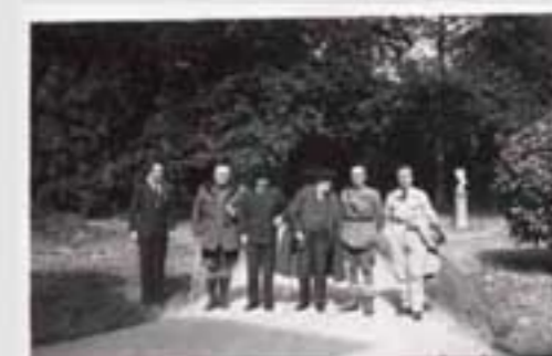
1919ko gorteko irudi. Irudiak ez dira berberak. (M.A. & 202005). © 2020 M.A. & 202005. Irudiak ez dira berberak.