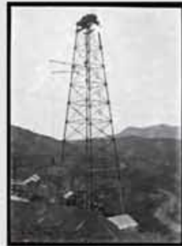
1880. Iratxearen inguruko paisaia. (1880). B.N. E. 00100.