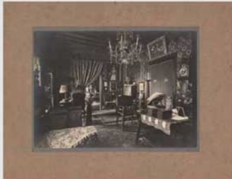
1918ko ezaberiaren 17an. Errotalde jauregia argazkia. BIA, 8, 20149. 17an. Errotalde jauregia argazkia. BIA, 8, 20149.