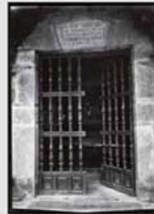
Santa Ana ermita. (B.I.A. & 001046).