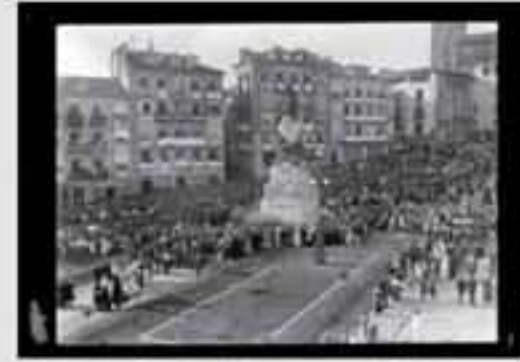
1911. Gaur egun gure gizartearen aisialdirako denbora izatea eta bidaiak egitea oso hedatuta dago.