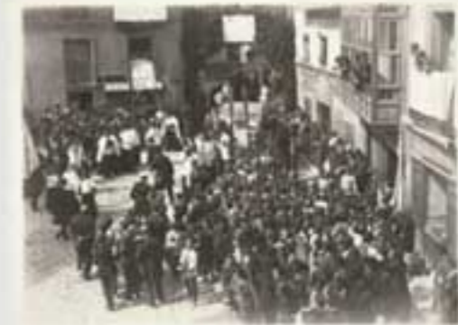
1901. Ermita Santa Ana. (B.I.A. & 001046).