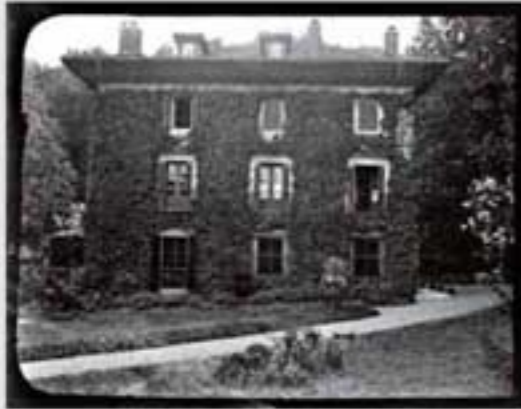
Errotalde jauregia. BIA, 8, 20148.