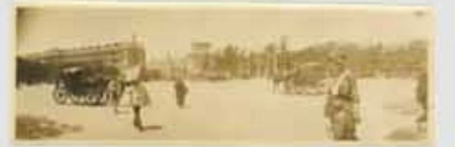
1911. Gaur egun gure gizartearen aisialdirako denbora izatea eta bidaiak egitea oso hedatuta dago.