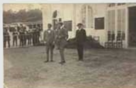
1919ko gorteko irudi. Irudiak ez dira berberak. (M.A. & 202005). © 2020 M.A. & 202005. Irudiak ez dira berberak.