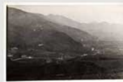
1919ko gorteko irudi. Irudiak ez dira berberak. (M.A. & 202005). Irudiak ez dira berberak.