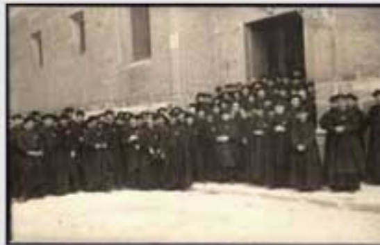
1900. Ermita Santa Ana. (B.I.A. & 001046).

El Conde del Valle se caracteriza por un catolicismo integrista que impregna su ideología política. Su pensamiento religioso va unido a signos externos de religiosidad en las que como muestra "destacada" de la sociedad toma parte activa; las procesiones de Bergara y Elorrio. Además tiene a gala ser dueño de la ermita de Santa Ana, lugar donde San Francisco de Borja dio su primera misa.