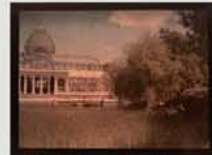
1911. Gaur egun gure gizartearen aisialdirako denbora izatea eta bidaiak egitea oso hedatuta dago.