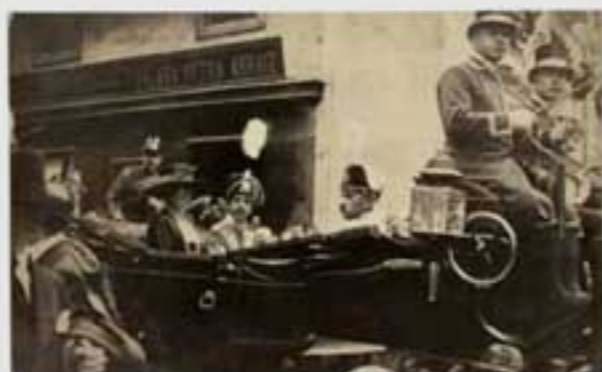
1919ko gorteko irudi. Irudiak ez dira berberak. (M.A. & 202005). © 2020 M.A. & 202005. Irudiak ez dira berberak.