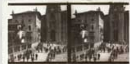
1900. Prozesio San Pedro elorriko aldean. (B.I.A. & 001046).