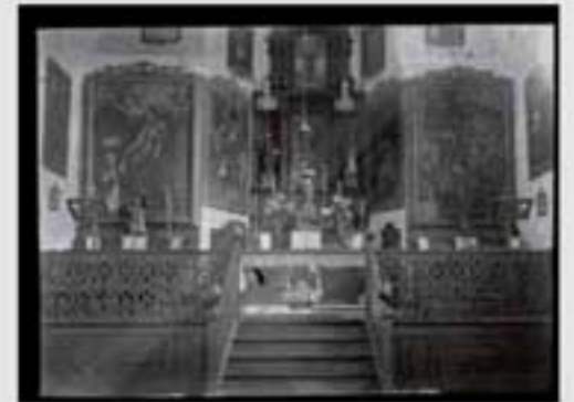
Santa Ana jauregia. BIA, 8, 20176.