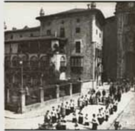
1900. Prozesio San Pedro elorriko aldean. (B.I.A. & 001046).