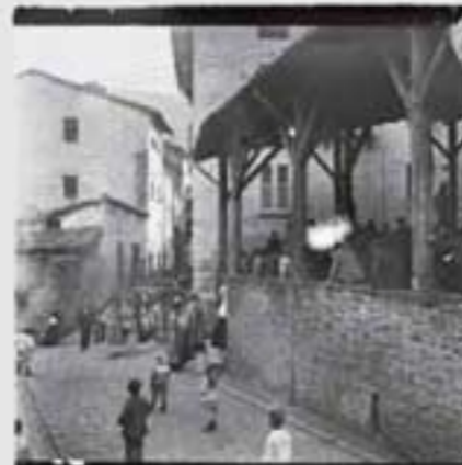
Prozesio San Pedro elorriko aldean. (B.I.A. & 001046).