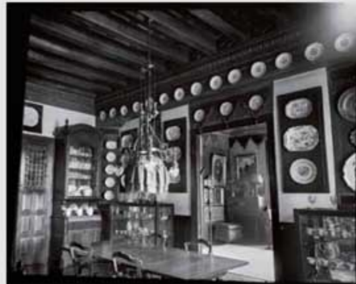
1918. Errotalde jauregia argazkia. BIA, 8, 20174.

El palacio de Rotelle es la casa principal de la familia Murua desde que en el siglo XVII Martín de Murua lo compró al volver de Sevilla con dinero. Ignacio Murua, IV Conde del Valle vivió en ella rodeado de la vajilla, cuadros y libros atesorados a lo largo de los siglos y con las comodidades propias de su tiempo llevó una vida acomodada.