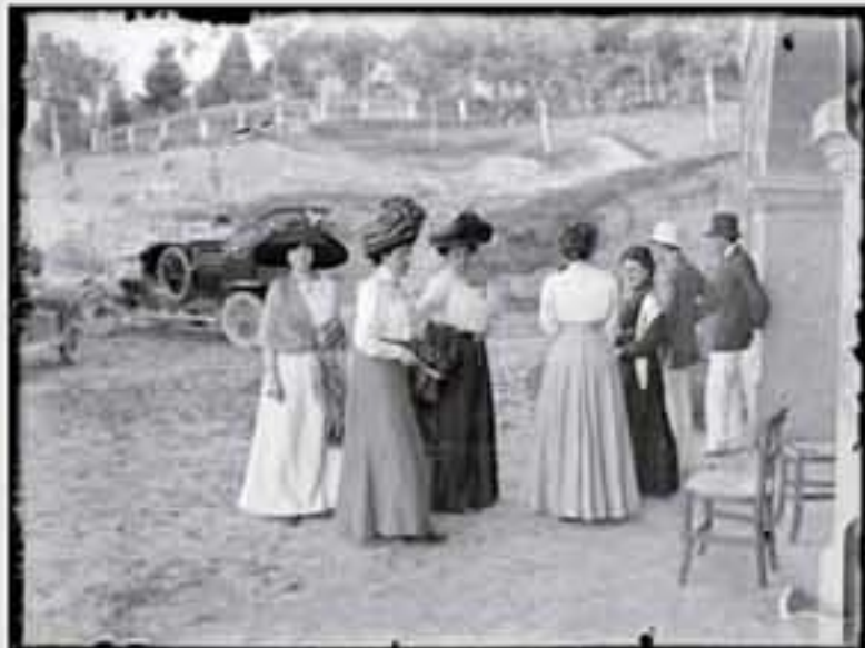
1911. Gaur egun gure gizartearen aisialdirako denbora izatea eta bidaiak egitea oso hedatuta dago.

Gaur egun gure gizartearen aisialdirako denbora izatea eta bidaiak egitea oso hedatuta dago. Valleko Kondearen garaian, ordea, gutxi batzuen esku zegoen; nahikoa diru eta denbora zutenek bakarrik egin zezaketen.