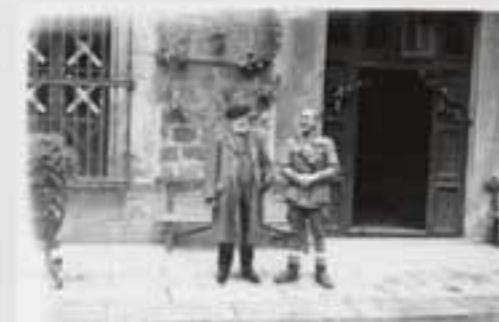
1917ko gorteko irudi. Irudiak ez dira berberak. (M.A. & 202005). © 2020 M.A. & 202005. Irudiak ez dira berberak.

Heredero por parte paterna de una tradición familiar carlista desde el siglo XIX, Ignacio Murua fue senador en 1907 por la candidatura católica fuertista. Es el integrisimo católico y el antiliberalismo lo que le lleva a apoyar al bando nacional en la guerra del 26.