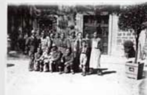
1918ko gorteko irudi. Irudiak ez dira berberak. Irudiak ez dira berberak.