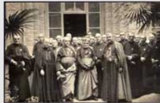
1900. Ermita Santa Ana. (B.I.A. & 001046).