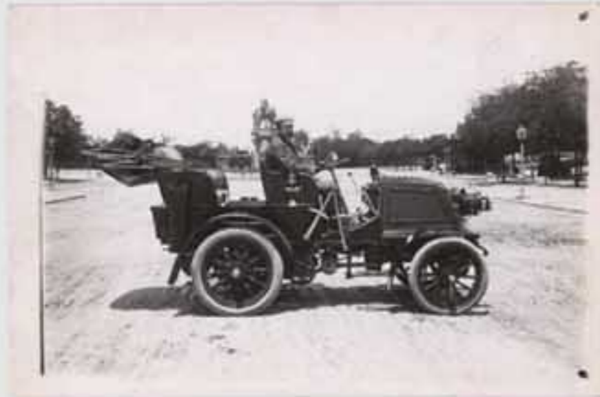
1870. Iratxearen inguruko paisaia. (1870). B.N. E. 00100.