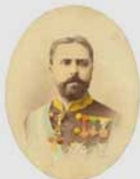
1879ko gorteko irudi. Irudiak ez dira berberak. (M.A. & 202005). © 2020 M.A. & 202005. Irudiak ez dira berberak.