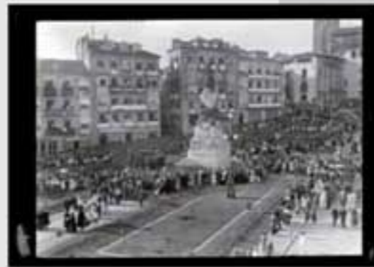
1841ko jurgaltze-erregistroaren (registro de bienes) ondoriozko erregistroaren irudi bat. (M. U. & I. 1841/1842). Erregistroaren irudi bat.

Aunque la institución del mayorazgo –que permitía mantener un conjunto de bienes vinculados, que no se podían vender– estuvo vigente hasta 1841, en muchas familias se mantuvo la dinámica de que la mayoría de los bienes los heredaba uno de ellos; la estrategia matrimonial estaba destinada a pagar la legítima de los demás herederos con el dinero aportado en los dotes.