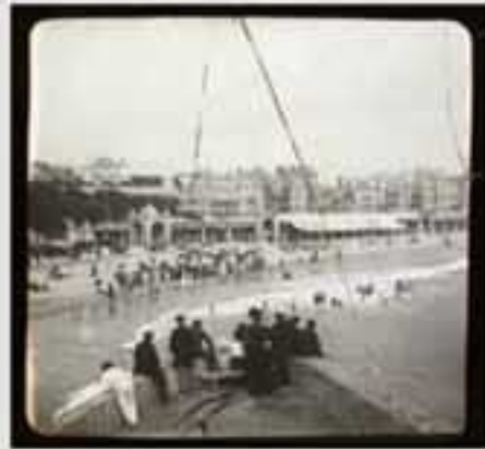
1911. Gaur egun gure gizartearen aisialdirako denbora izatea eta bidaiak egitea oso hedatuta dago.