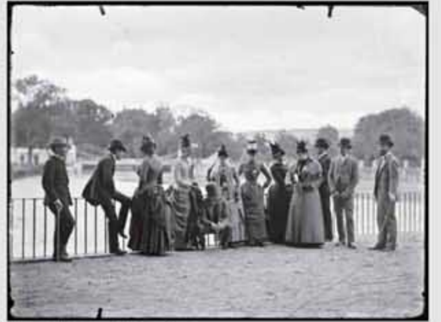
1880. Iratxearen inguruko paisaia. (1880). B.N. E. 00100.