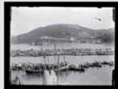
1911. Gaur egun gure gizartearen aisialdirako denbora izatea eta bidaiak egitea oso hedatuta dago.

Actualmente viajar y disponer de tiempo libre son actividades muy extendidas en nuestra sociedad. Tenemos que pensar que en la época del Conde del Valle visitaban solo al alcance de unas pocas que disponían tanto de recursos económicos como de tiempo para ello.