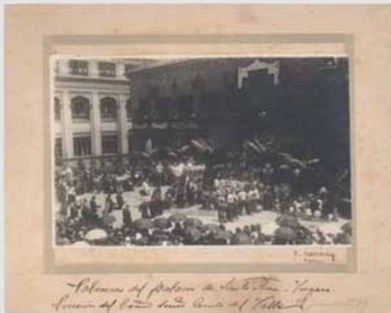
1900. Ermita Santa Ana. (B.I.A. & 001046).