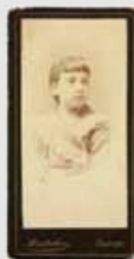
1882ko gorteko irudi. Irudiak ez dira berberak. (M.A. & 202005). © 2020 M.A. & 202005. Irudiak ez dira berberak.