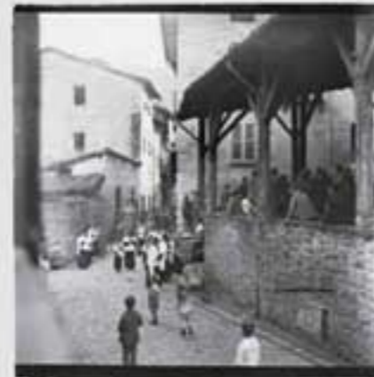
Prozesio San Pedro elorriko aldean. (B.I.A. & 001046).