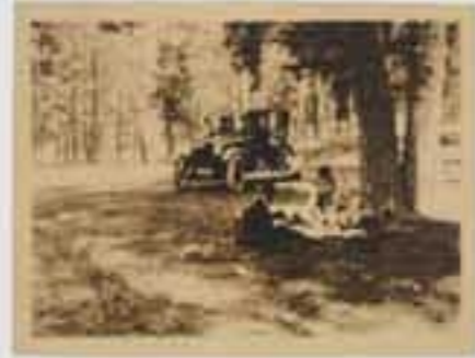
1870. Iratxearen inguruko paisaia. (1870). B.N. E. 00100.