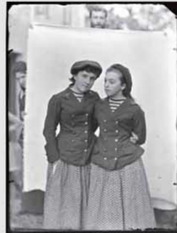
1880. Iratxearen inguruko paisaia. (1880). B.N. E. 00100.