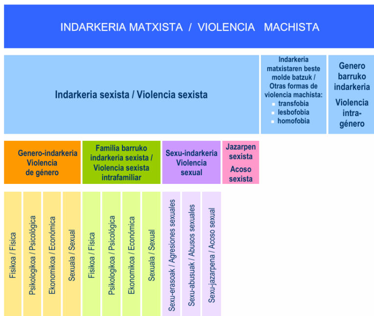
5. irudia Terminologiaren eskema Figura 5: Esquema terminológico

Horrez gain, Gipuzkoako Foru Aldundiak indarkeria matxistari buruz erabiliko den terminologia eta horren oinarria den azterketari buruzko agiri bat argitaratu zuen 2014an (dokumentua hemen ikus daiteke: Terminologia-Indarkeria matxistaren arloko kontzeptuak ). Agiri horretan terminologia bat proposatzen du, indarkeriari aurre egiten dieten emakumei arreta ematen dieten foru zerbitzuetan erabiliko dena