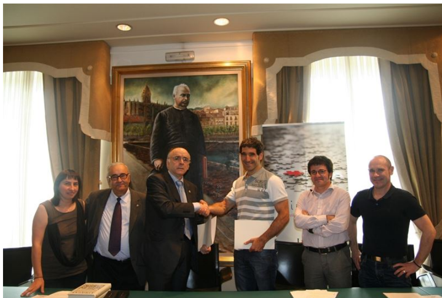
Euskaltzaindia hitzarmenaren sinadura